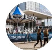
Fläche im Freien