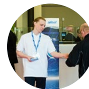
Distribuzione di omaggi nei pressi del guardaroba