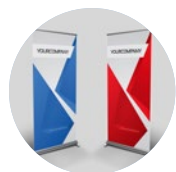
Spazio per Roll-up