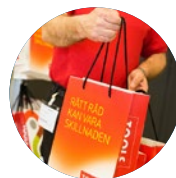
Sacchetto/borsina di benvenuto