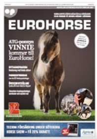
Rivista della fiera